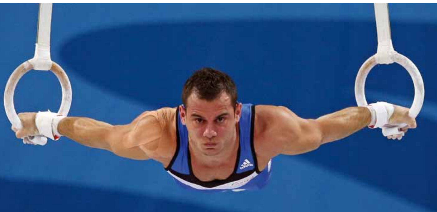
Samir Ait Saïd