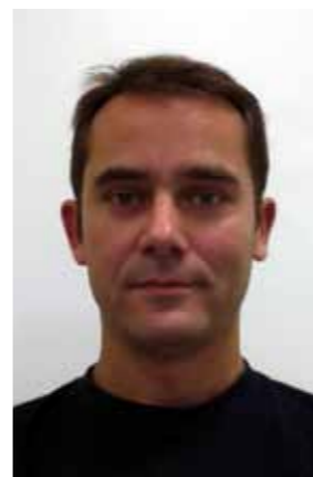
Directeur Technique National Adjoint