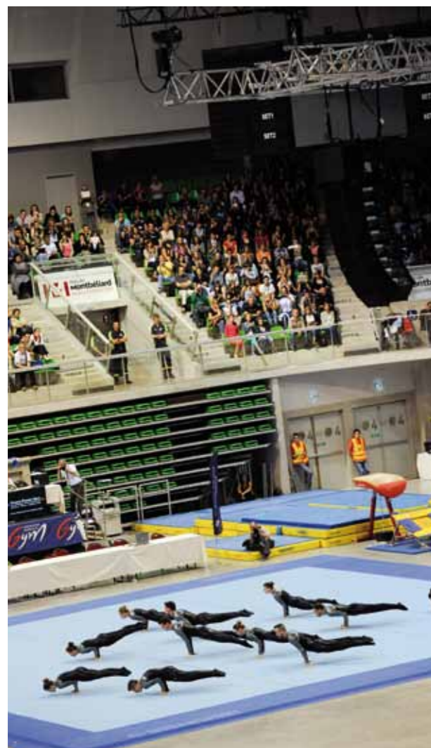
Festigym à Montbéliard