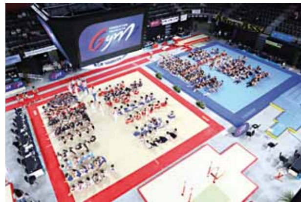
Le plateau de compétition de Bourg-en-Bresse