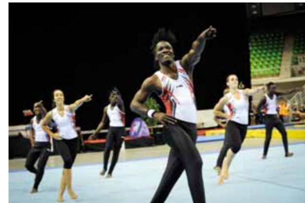
L'ambiance et la fête