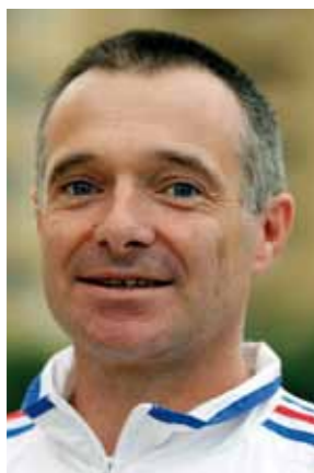
Directeur Technique National Adjoint