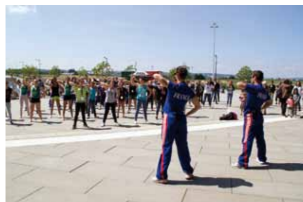
Festigym à Montbéliard

La FFG s'est engagée à développer une politique sportive en faveur de la santé de ses pratiquants.