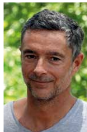
Délégué Administratif de Zone

La saison 2013-2014 des régions d'outre-mer a une nouvelle fois mis en avant l'excellence de ses résultats sportifs et le dynamisme de son développement :