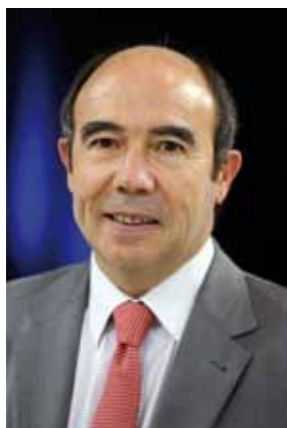
Président de la Commission Nationale du développement territorial

La saison 2014 a vu la mise en place du Contrat d'Objectif Territorial.