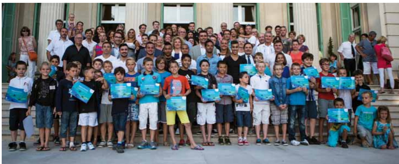
Olympique Antibes Juan-Les-Pins

« Harmoniser, rendre plus lisible et simplifier », trois mots qui résument les orientations de cette Commission. La CNJ s'est réunie deux fois, le 10 janvier à Paris et le 19 septembre à Bourges, et s'est concentrée sur trois principales missions :