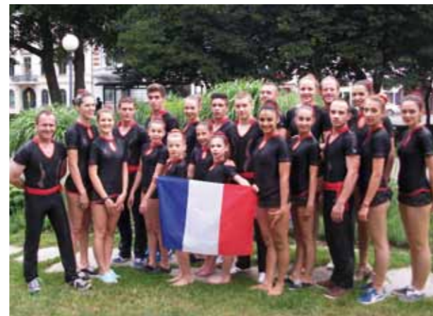
Le groupe de l'Union Gymnique Val-de-Saône

L'Eurogym 2014 s'est tenu à Helsingborg, ville suédoise de près de 100 000 habitants. Pour cette 9 ème édition, 4 500 participants étaient attendus. Ils ont pu, le temps