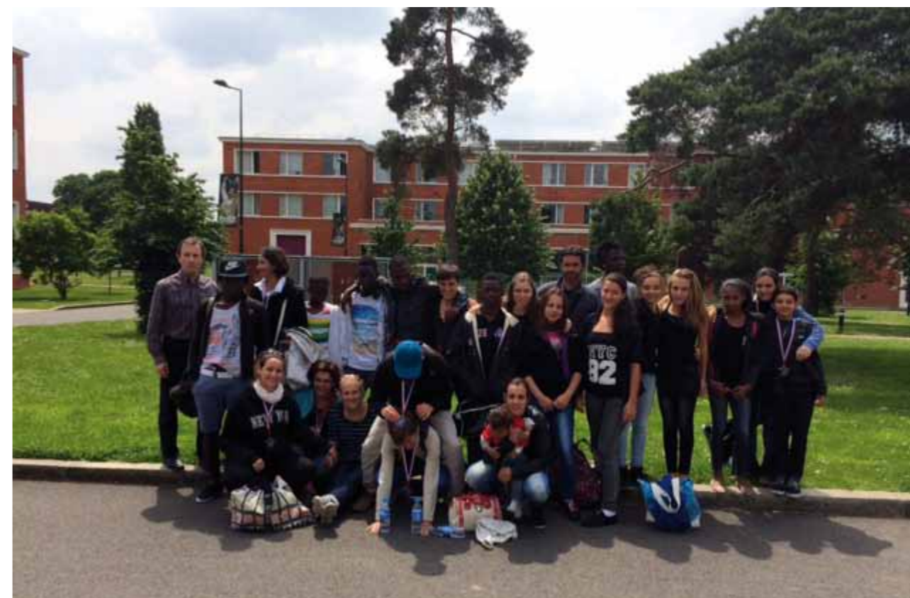
Le comité de Guyane en visite à l'INSEP

La Commission des Jeunes, malgré le manque de disponibilité de certains de ses membres, a travaillé sur des projets qui devraient voir le jour en 2015, comme par exemple des fiches explicatives des disciplines de la Fédération, une élection du gymnaste d'or et du meilleur espoir.