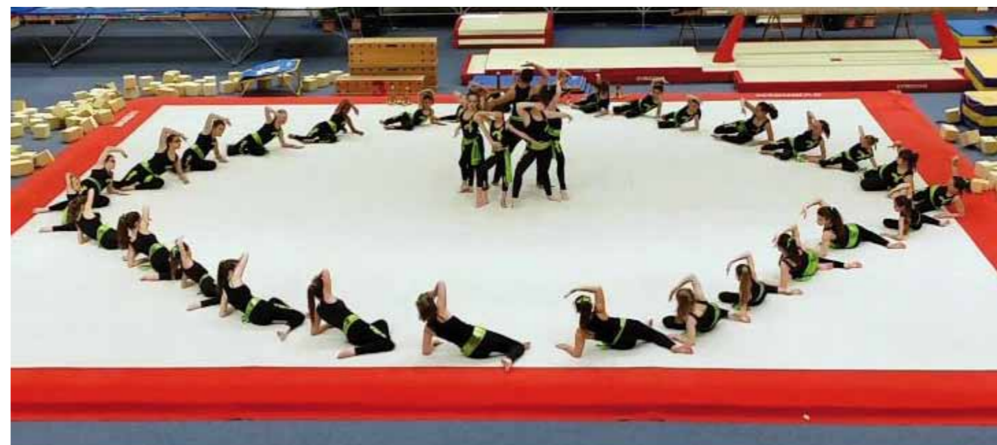
Saint Symphorien Gymnastique Tours