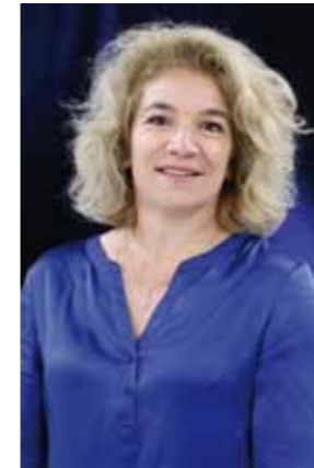
Directrice Technique Nationale

En cohérence avec ce qui a été annoncé, cette 1ère année nous a permis d'initier le changement envisagé dans le projet fédéral.