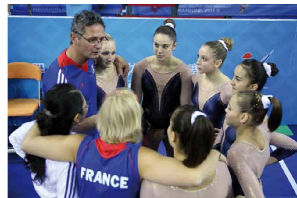
L'équipe de France de Gymnastique Artistique Féminine

La démarche de modernisation dans laquelle la FFG s'est engagée doit se faire au bénéfice des acteurs de la vie gymnique. Elle ne peut s'opérer qu'avec votre concours et votre soutien.