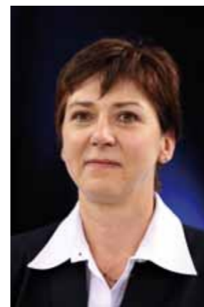
Vice-Présidente en charge des Pratiques fédérales

Comme chaque année, la Commission des Pratiques Fédérales doit faire face à la gestion de la saison en cours et à la préparation de la suivante. Depuis le dernier congrès électoral, elle est également en charge de la rénovation du système compétitif. Plusieurs réunions ont permis à la Commission Nationale Permanente des Pratiques Fédérales et aux Responsables Techniques Fédéraux de toutes les disciplines de poser un cadre dans lequel vont évoluer les acteurs de la rénovation des pratiques fédérales avec des objectifs et des échéances communs.