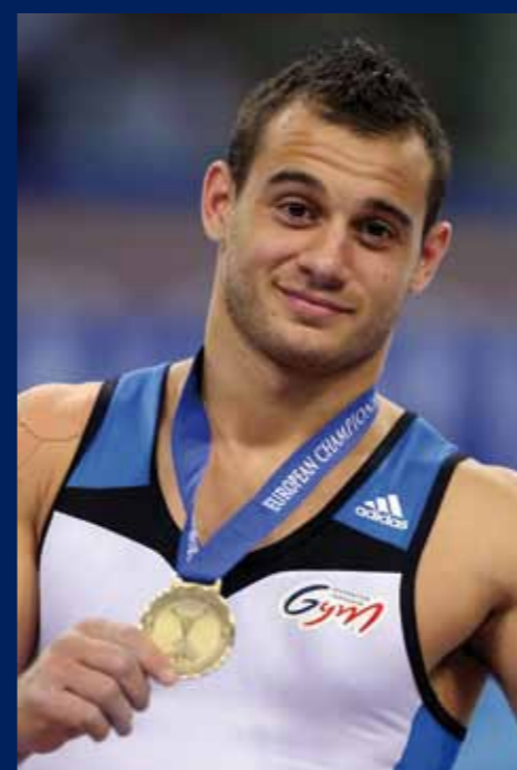
Samir Aït Saïd médaillé de bronze aux anneaux