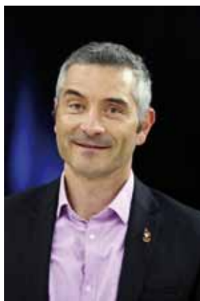
Vice-Président en charge du Haut Niveau

À partir de l'état des lieux réalisé depuis les élections de mars 2013, le projet pour le Haut Niveau est présenté au congrès en décembre de la même année, avec un point d'étape lors du colloque des structures déconcentrées programmé en avril 2014. Il s'agit maintenant de faire un premier bilan de nos actions et réalisations depuis le congrès d'Orléans.