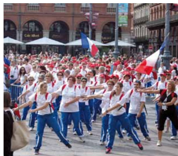
Animation Place du Capitole à Toulouse

Toulouse, capitale de la plus grande région française, Midi-Pyrénées, a accueilli la 4 ème édition du Golden Age Gym Festival. Un lieu d'exception, bordé de nombreux grands sites historiques et des paysages naturels exceptionnels, pour un événement prestigieux. 2000 gymnastes « Seniors » ont ainsi eu la chance d'y participer et d'arpenter la ville rose. Au programme : parade dans les rues, ateliers gymniques, sportifs et culturels, performances de groupes, visites touristiques et galas. Les participants, parmi lesquels de nombreux Français, ont ainsi vécu une belle semaine de la Gym version Senior !