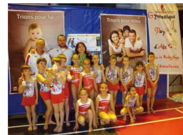
Gymnastique Pays d'Aix