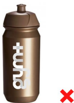
Goodies ne respectant pas les couleurs gym+ : interdit