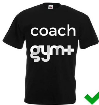
Logo blanc sur textile noir : autorisé