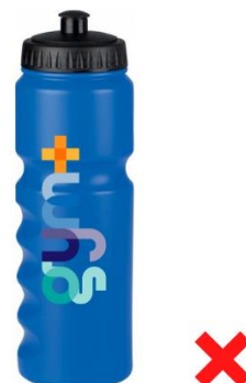
Logo couleur sur goodies couleurs : interdit