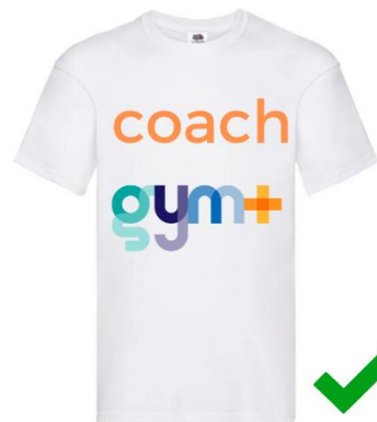
Logo couleur sur textile blanc : autorisé