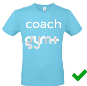
Logo blanc sur textile couleur : autorisé