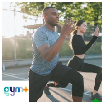
Logo couleur sur fond blanc : autorisé