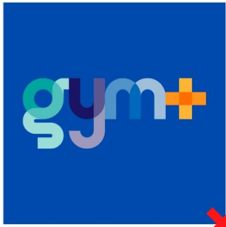
Logo couleur sur fond couleur ou noir : interdit