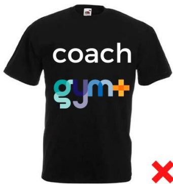
Logo couleur sur textile noir ou couleur : interdit