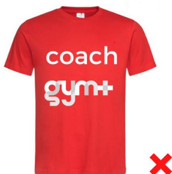
Textile ne respectant pas les couleurs gym+ : interdit