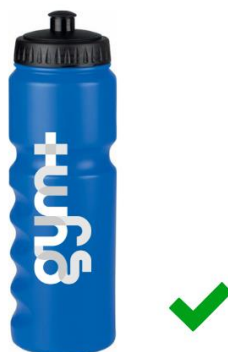
Logo blanc sur goodies couleurs : autorisé