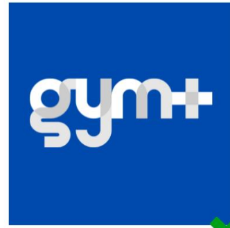
Logo blanc sur fond couleur : autorisé